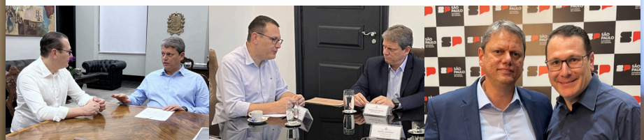
O deputado Rafa Zimbaldi e o governador Tarcísio de Freitas em diferentes reuniões para tratar de investimentos na Região de Campinas.